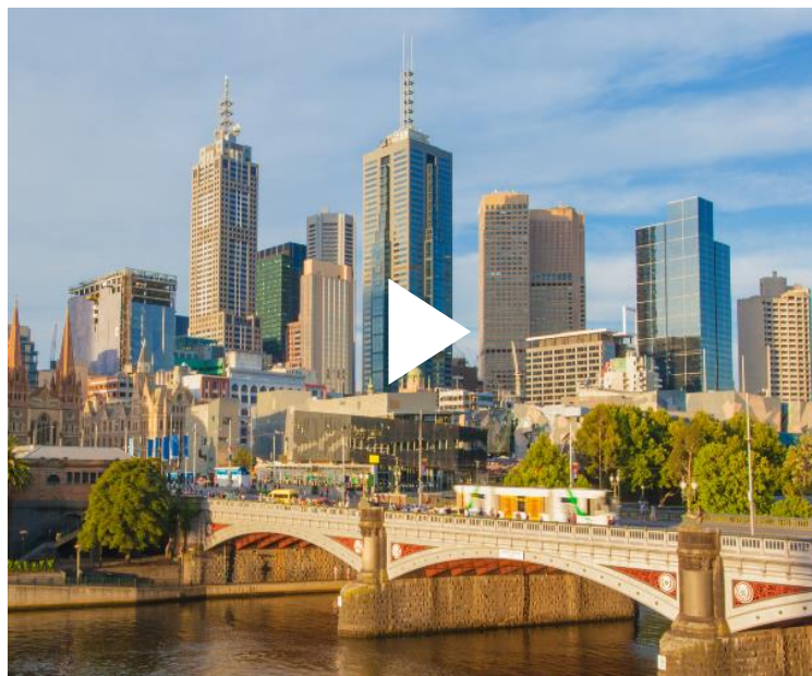
Club del Año 2021 - 2022 Skål International Melbourne