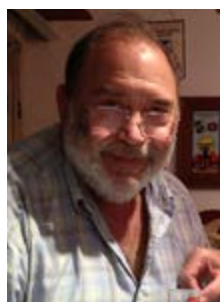
Mensaje del Presidente del Comité Nacional de los Skål Clubs del Uruguay

El Turismo es una industria que, anticipándose a los deseos de sus clientes, logra que éstos cumplan sus sueños, conozcan pueblos, culturas y países diferentes, fomentando así la concordia y la tolerancia.